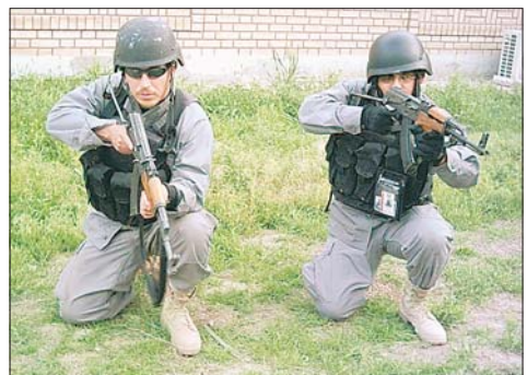
INTERESADOS. Agentes de seguridad privados, policías con licencias, ex combatientes del Ejército y ex guerrilleros forman parte del grupo de salvadoreños que aspira a ganar más de 1 mil dólares mensuales en el Oriente Medio.