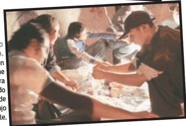
Arduo trabajo. Teñir la sal con los colores que necesitaban era el segundo paso, luego de trazar el dibujo en la calle.