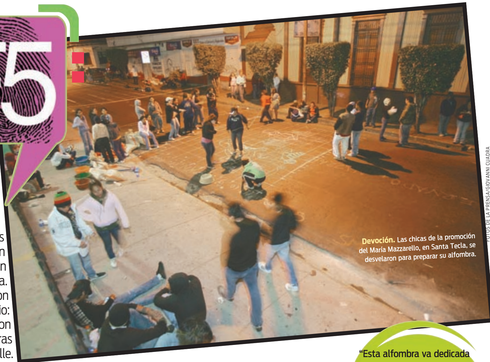
Devoción. Las chicas de la promoción del María Mazzarello, en Santa Tecla, se desvelaron para preparar su alfombra.

Muchos bichos y bichas demostraron su amor a Dios en esta Semana Santa. Lo hicieron con sacrificio: se desvelaron diseñando alfombras de sal en la calle.